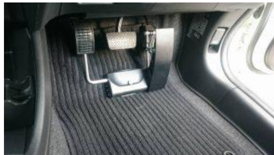
左足アクセル(右麻痺)