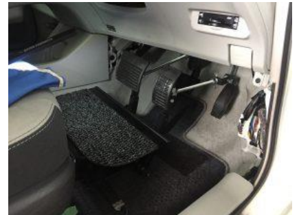
ペダル延長(低身長)

ですが、現在、佐賀県内のすべての自動車学校は障害者専用教習用の車両を所有していないことが現状です。 それではどうすれば免許が取れるか?